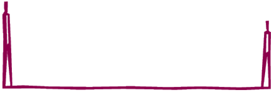
Kuvio 3: Yhteenvedo toteutuneista tuloista ja menoista vuosina 2011 – 2012 sekä vuoden 2013 ennuste ja vuoden 2014 talousarvio