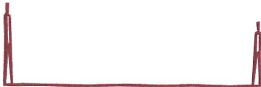
Kuvio 4: Määrärahatason muutosesitysten vaikutukset määrärahoihin