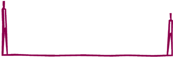
Kuvio 3: Yhteenvedo toteutuneista tuloista ja menoista vuosina 2012 – 2014 sekä vuoden 2015 ennuste ja vuoden 2016 talousarvio